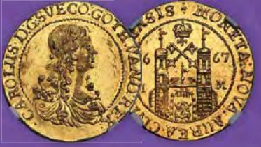
Livland: Riga - Schwedische Besatzung Karl XI. Gold 2 Dukaten 1667-IM MS62 NGC Zuschlagpreis: $72.000