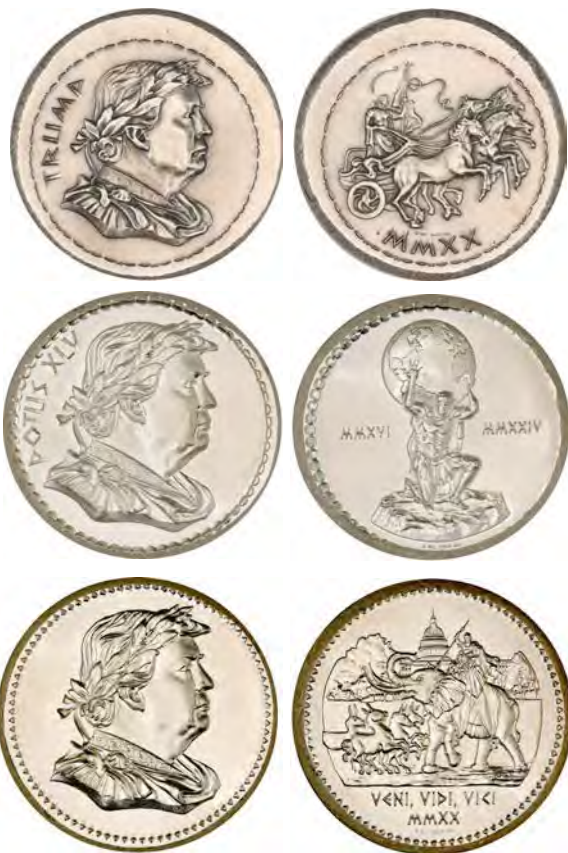
Trumpus Augustulus, Herrscher über Land und Meer

Das ist schwer zu beantworten, denn mit der Wahl Donald Trumps in eine zweite Amtszeit als US-Präsident rechnet sich bestimmt der eine Staat oder das andere Ländchen aus, dass man