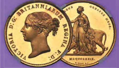
Großbritannien: Victoria Gold Proof „Una und der Löwe“ 5 Pfund 1839 PR62 Ultra Cameo NGC Zuschlagpreis: $288.000