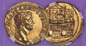
Claudius I. (AD 41-54). AV-Aureus NGC MS 4/5 - 4/5 Zuschlagpreis: $126.000