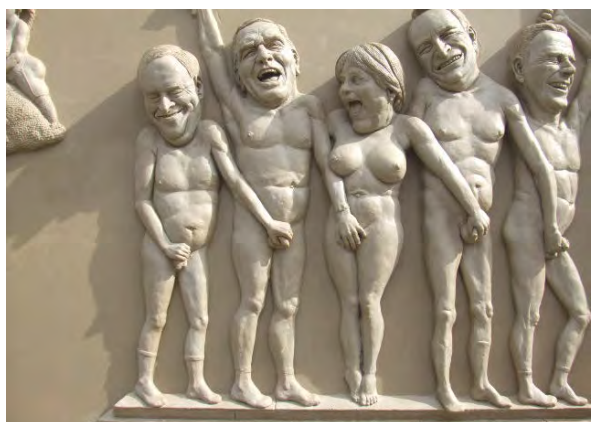
Detail der Skulptur „Ludwigs Erbe“ von Peter Lenk, Ludwigshafen am Bodensee, von links nach rechts: Hans Eichel, Gerhard Schröder, Angela Merkel, Edmund Stoiber und Guido Westerwelle.

Wahrscheinlich können uns die erwartbaren Münzprägungen nicht mehr überraschen – oder doch?