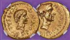
Octavian, als Konsul (ca. 43 v. Chr.), mit Julius Caesar, als Dictator Perpetuo und Pontifex Maximus. AV aureus NGC-Grade XF 3/5 - 4/5 Zuschlagpreis: $288.000

Wir nehmen jetzt Einlieferungen für unsere offiziellen CSNS-Auktionen an Abgabetermin: 24. Februar