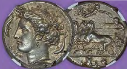
SIZILIEN. Syrakus. Dionysius I. (405-370 v. Chr.). AR-Dekadrachme NGC AU★ 5/5 - 5/5, Fine Style Zuschlagpreis: $132.000