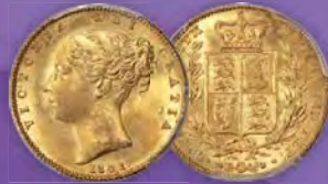
Grossbritannien: Victoria Gold „Shield“ Sovereign 1841 MS65+ PCGS Zuschlagpreis: $96.000