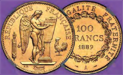
Frankreich: Republik Gold Proof 100 Francs 1889-A PR63 Cameo NGC Zuschlagpreis: $108.000