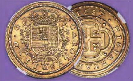
Spanien: Karl II. Gold 8 Escudos 1687/3-BR MS64 NGC Zuschlagpreis: $96.000

Prices Zuschlagpreis: From Our 2024 CSNS Auction