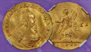
Russland: Elisabeth Gold „St. Andreas“ Dukat 1751-АПРЕЛ (April) AU55 NGC Zuschlagpreis: $96.000